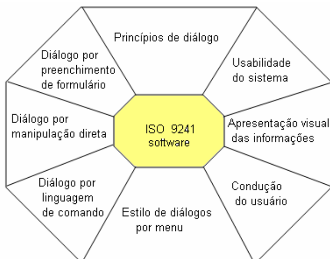
Figura 3.2 - Norma ISO 9241 – ERGONOMIA NO TRABALHO EM ESCRITÓRIO INFORMATIZADO